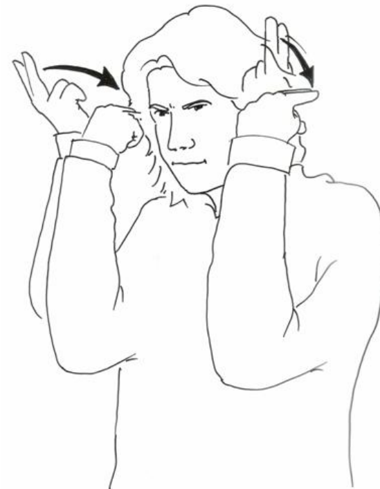
Figur 3

DS- Redewendung: „Den Schwanz einziehen“ (RW- Duden 2008, S. 629)