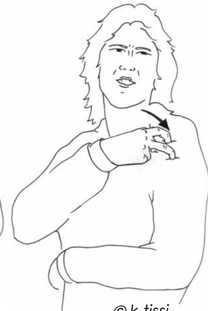
Figur 5: Gebärde „BLAU“