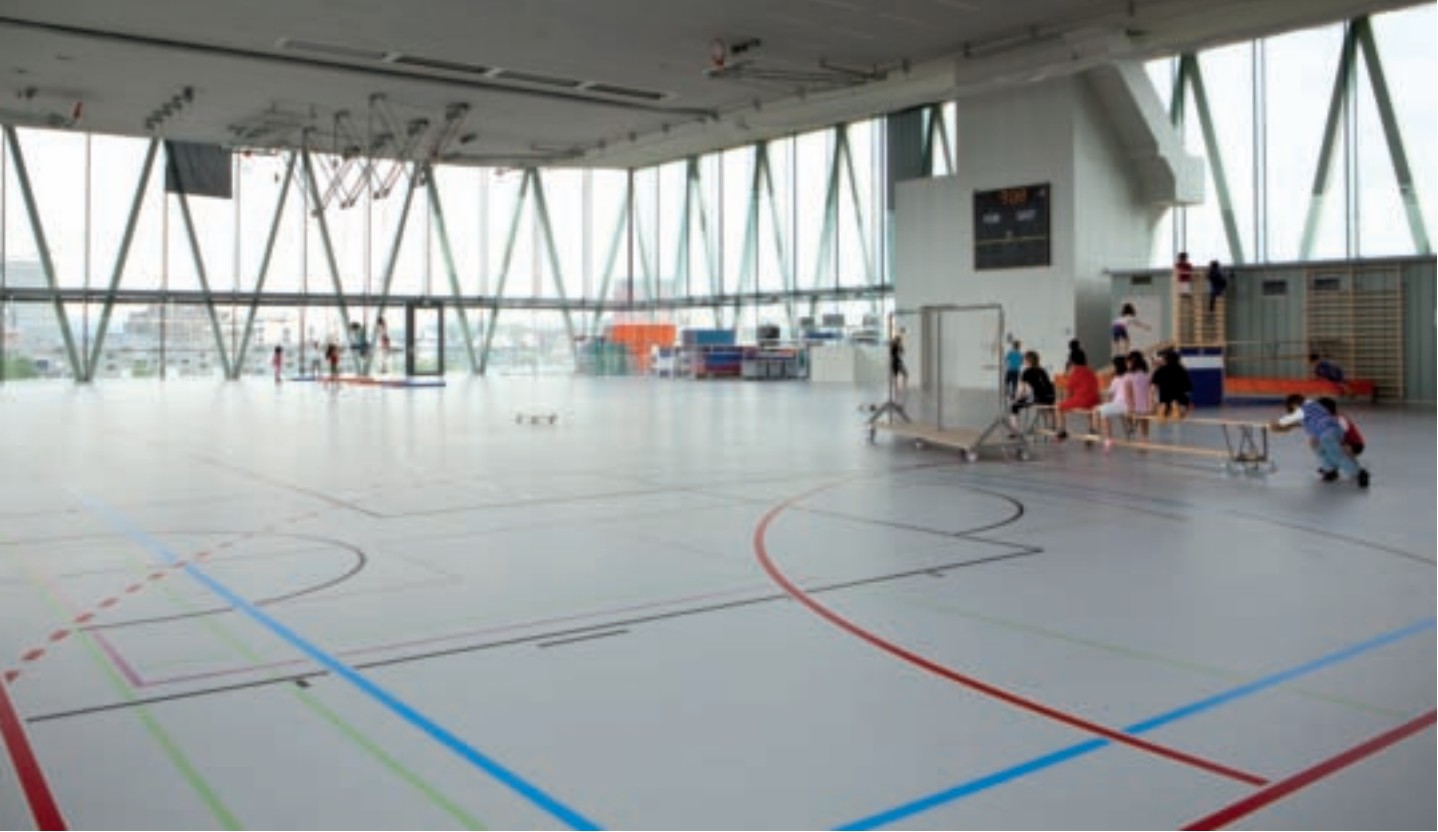
Das Messen der Gefühle zeigt: Nicht nur Turnen macht Spass