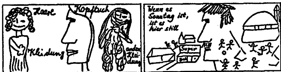
Abb. 2: «Ikonische» Schülertexte (aus Hiller 1994 a, S. 104f.)

Dasselbe Prinzip, den Jugendlichen und jungen Erwachsenen grundlegende Erfahrungen und Bedingungen aus ihrem Alltagsgefüge strukturiert und systematisch, aber zugleich vereinfacht, zugänglich zu machen und begleitet wieder in die Hände zu geben, lässt sich auf andere Bereiche übertragen. Unter dem Titel «Durchblick im Alltag» hat Hiller entsprechend aufbereitete Hefte und Lehrerhefte vorgelegt (vielleicht wäre ihm der Ausdruck «Begleiterhefte» lieber gewesen), in denen Themen wie Lebenslauf, Ausbildung, Freizeit, Wohnen, Versicherungen und Finan-