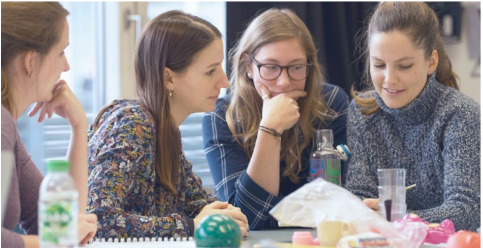
Gruppenarbeit im Master Heilpädagogische Früherziehung.

Die Module à je 5 ECTS-Kreditpunkte umfassen rund 150 Stunden Workload. Diese teilen sich jeweils auf in Kontaktstudium und begleitetes Selbststudium sowie freies Selbststudium.