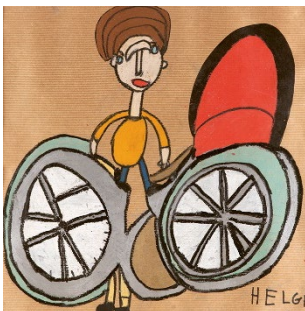
Bild: Ulla Diedrichsen 2008 / © Freunde der Schlumper e. V. Hamburg